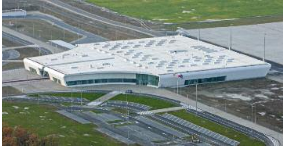
Nowoczesny terminal portu lotniczego Lublin w Świdniku

Choć minęła już narodowa mobilizacja związana z przygotowaniem do Euro 2012, nie oznacza to bynajmniej końca rozwoju infrastruktury lotniczej. Gotowy jest już zbudowany od podstaw port lotniczy Lublin w Świdniku z nowoczesnym terminalem, zaawansowane są prace przy budowie przeznaczonego dla tanich linii lotniczych portu Gdy-