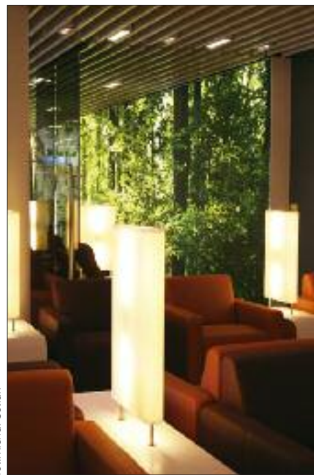
Frankfurt – poczekalnia senatorska

Czterokondygnacyjny pirs A-plus może jednocześnie obsługiwać do 11 samolotów, w tym największe Boeingi 747-8 i Airbusy A380