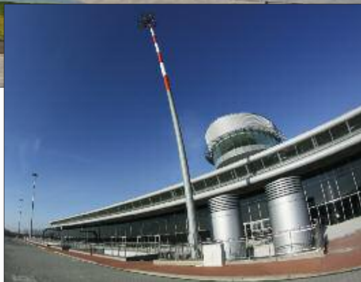
Stylistykę łódzkiego terminalu można określić jako oszczędną elegancję

W ciągu kilku lat polskie porty lotnicze pokonały olbrzymi dystans, dzielący je od lśniących lotnisk Europy Zachodniej