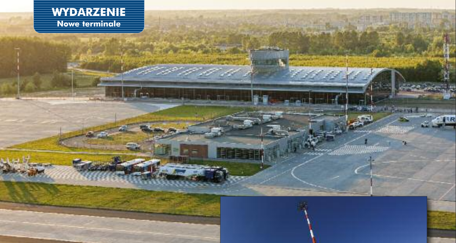
W czerwcu ruszył nowy terminal w Łodzi – stary po demontażu trafi do Radomia

wity koszt budowy (w tym rozbiórki stojącego wcześniej w tym miejscu hangaru) wyniósł 700 mln euro.