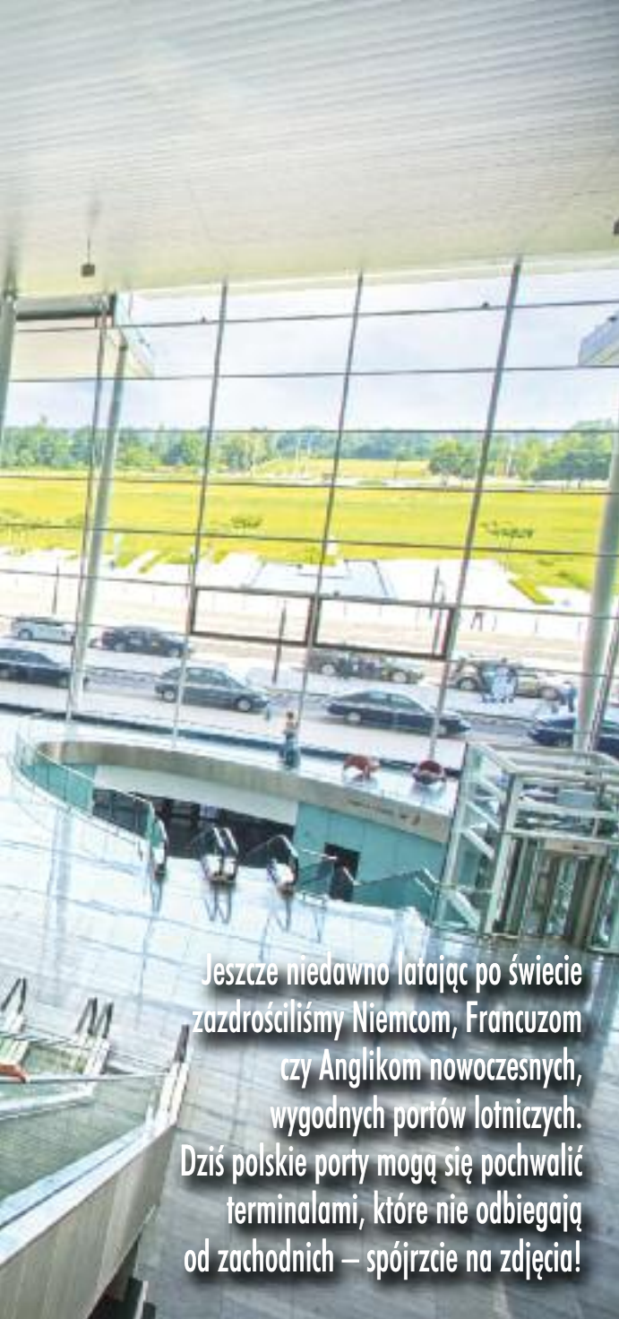
fat. Port Lotniczy Wrocław (2)

Jeszcze niedawno latając po świecie zazdrościliśmy Niemcom, Francuzom czy Anglikom nowoczesnych, wygodnych portów lotniczych. Dziś polskie porty mogą się pochwalić terminalami, które nie odbiegają od zachodnich – spójrzcie na zdjęcia!