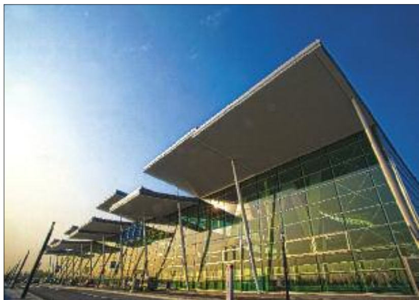
Na zdjęciach powyżej i z lewej to nie Frankfurt, tylko nowy terminal we Wrocławiu

Jeszcze niedawno latając po świecie zazdrościliśmy Niemcom, Francuzom czy Anglikom nowoczesnych, wygodnych portów lotniczych. Dziś polskie porty mogą się pochwalić terminalami, które nie odbiegają od zachodnich – spójrzcie na zdjęcia!